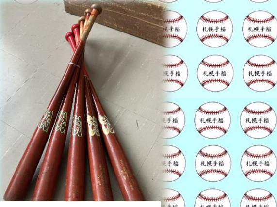
見た目にこだわって (整理、整頓、清潔:3S)