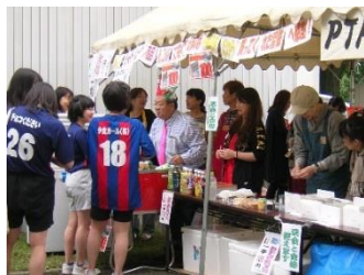
おでん食べたかな？