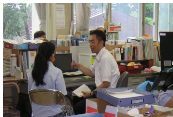
昼休みに個人面談

昼休みや放課後にはホームルーム担任がひとりひとり生徒と面談を行っています。また保護者を対象に理系・文系別進路説明会のほか、科目選択やキャリア学習などの説明会も実施しいつも多数ご参加いただいています。進学型単位制の特色をご理解いただき家庭と学校が協力し生徒の夢、進路実現にむけて取り組んでいます。