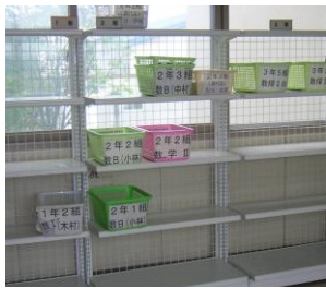
課題提出専用のカゴ

講習は言わずと知れた名物ですが、その他にも課題提出があります。教科担任はそれを全て点検し返却しています。本校は“毎日”そして“コツコツ”がキホンです。これもりっばな手稲高校の名物です。