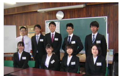
今日もがんばります。