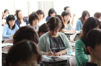
1年次保護者説明会で

6月8日(火)の本校卒業生の名の教育実習が2週から4週の期間行われました。懐かしい校舎であっても教える立場になるとすいぶん景色が違ったようです。放課後には所属していた部活動に顔を出したり学校祭準備中の後輩たちに声をかける姿なども見られました。この実習で教鞭を執る気持ちが一層強くなったそうです。みなさんの夢が叶うように願っています。